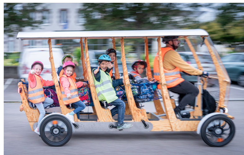
S'Cool bus Le Manoir

C'est bien plus qu'un vélo : un outil pédagogique , une solution de mobilité concrète et un levier de transition pour les collectivités. Écologique, silencieux et conçu pour durer , le Woodybus offre une expérience de transport scolaire innovante, tout en initiant les enfants à la pratique du vélo de manière ludique et encadrée .